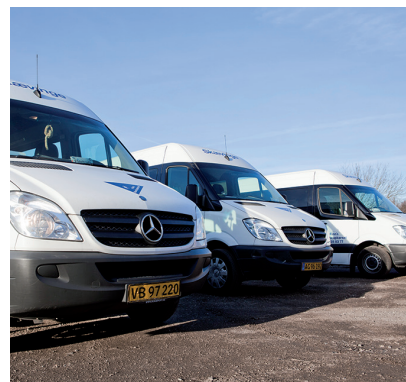
Finns Handicapkørsel råder over 29 minibusser, som alle har Sirius installeret.

„Det kommer selvfølgelig an på, hvor mange køretøjer man har. Jeg bruger systemet til at holde styr på, hvor bilerne er henne, og om chaufførerne kører hensigtsmæssigt. Til det formål har Sirius fungeret upåklageligt.“